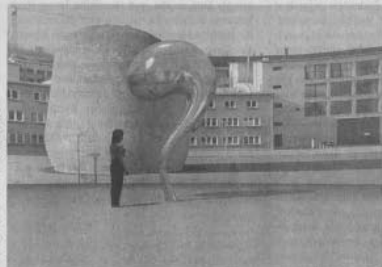
Inges Idee, Superposition

Der Entwurf 1118 „Greips Spiel“ (Roland Boden) legte auf die Parkfläche zwei monumentalisierte Kreisel aus Aluminium ab, die wie das Spielzeug eines Riesen (Greip ist der Name einer Riesin aus dem germanischen Göttergeschlecht der Asen) zufälligerweise liegen geblieben sind. Dabei verfügte der eine Kreisel über eine geschlossene Form, während der zweite seine konstruktive Struktur offenbarte, somit formal an eine Turbine erinnerte und damit den Zusammenhang von Wissenschaft, Technik und Spiel verdeutlichte.