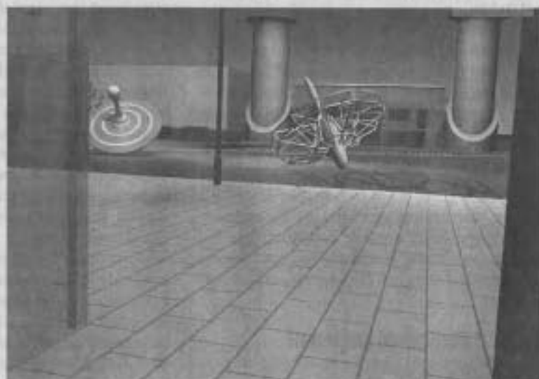
Illustration Inges Idee