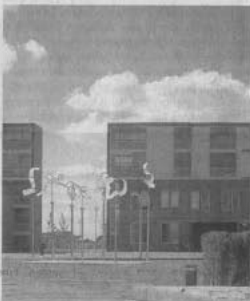
Frank Dehring, Strings

Im zweiten Wertungsrundgang erreichten nur die Entwürfe 1111 und 1115 die erforderliche Mindestzahl von 6 Für-Stimmen.