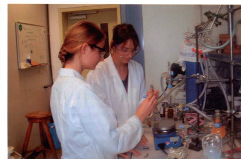
Abb. 3 Studentinnen im Forschungspraktikum