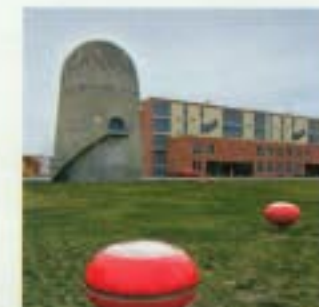
Zukunftsmusik: Aus den roten Objekten im Technologiepark dringen historische Cockpit-Gespräche.