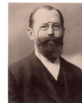
Emil Fischer (1852–1919) Namenspatron des Gebäudes des Instituts für Chemie

Seit Jahrzehnten führt das Institut für Chemie zudem Vorlesungen im Rahmen der Chemischen Schülergesellschaft durch. Jedes Jahr werden rund 10 Vorlesungen mit Experimenten aus den verschiedenen Gebieten der Chemie durch Hochschullehrer und wissenschaftliche