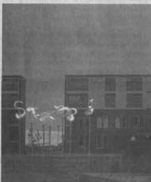
Illustration Frank Dehring

Sich in ein laufendes Wettbewerbsverfahren mit einer Unterschriftenaktion einzubringen, hat es in Berliner Kunstwettbewerben noch nicht gegeben. Eine solche Aktion ist sowohl Ausdruck von mangelndem Verständnis gegenüber zeitgenössischer Kunst als auch von mangelnder Kreativität und Neugierde und eines unsensiblen Umgangs mit den schöpferischen Leistungen