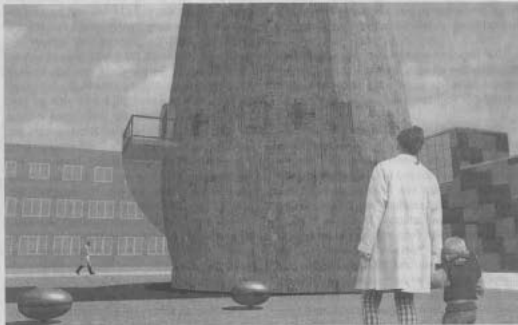
Stefan Krüskemper, soundscape

Zu fragen bleibt auch, ob in Anbetracht des relativ hohen Investitionsbetrages der eingela-dene Wettbewerb unter neun Künstlern die adäquate Verfahrensform gewesen ist. Beispielsweise hätte eine vorgeschaltete, offene Bewerbungsphase jüngeren und noch unetablierten Künstlerinnen und Künstlern eine breitere Teil-