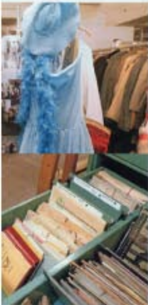
Zeitreise: Mehr als 40.000 Kostümteile beherbergt der Adlershofer Requisitenfundus.

› Adlershofer Requisiten- und Kostümfundus Ernst-Augustin-Straße 7 Telefon 030/67 04 42 22 www.fundus-berlin.de